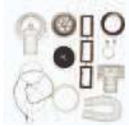
1 X 454202