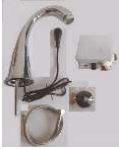
1 X 060804